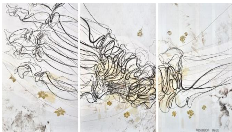
Hungertuch 2021

alle zwei Jahre steht im Zentrum der großen Fastenaktion von Misereor und Brot für die Welt ein neues Hungertuch. Das diesjährige Motiv ist geleitet von der politischen Bewegung in Chile für mehr soziale Gerechtigkeit und ein menschenwürdiges Leben, aber auch von den Erfahrungen der Pandemie. „Das dreiteilige Hungertuch