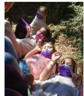
Spielerunde im Anschluss ans Grillen

Ganz liebe Grüße und frohe Ostern aus dem sonnigen Valdivia!