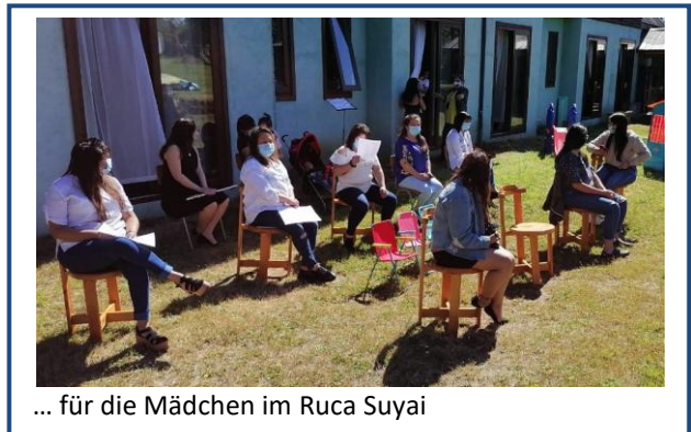
... für die Mädchen im Ruca Suyai

haben, was das Beste für das Kind ist, spielen bei den staatlichen Stellen auch andere Erwägungen eine Rolle. Man möchte zum Beispiel nach außen gut dastehen und hohe Rückführungsquoten präsentieren. So vermischen sich Politik und Pädagogik miteinander, was nicht immer zum Wohle der Kinder ist. Wenn es dagegen von Vorteil ist, dann bedient man sich staatlicherseits gerne der funktionierenden Strukturen unter den Einrichtungen.